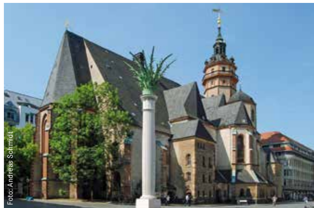
Nikolaikirche und Friedenssäule