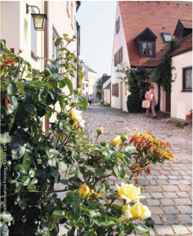
Graben am St. Georgs Haus

Reservierungswort: ZWS und Patientenkongress 2014 ( bitte immer komplett angeben )